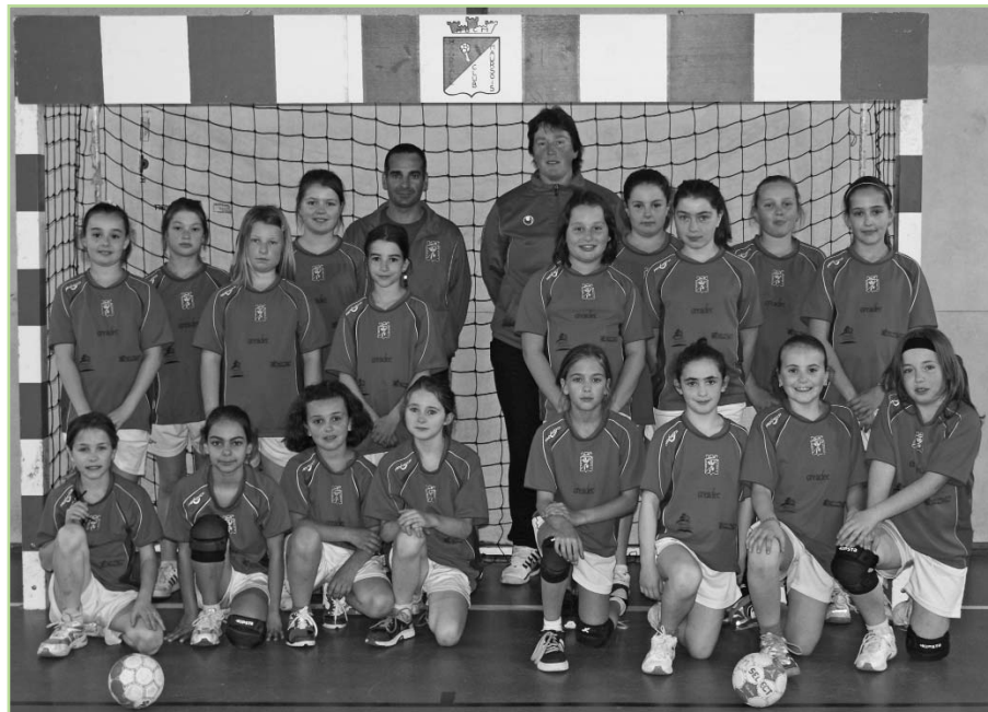
Les moins de 11 ans

Notre petit club grandit vite : en début de saison, il a accueilli 31 nouveaux licenciés !