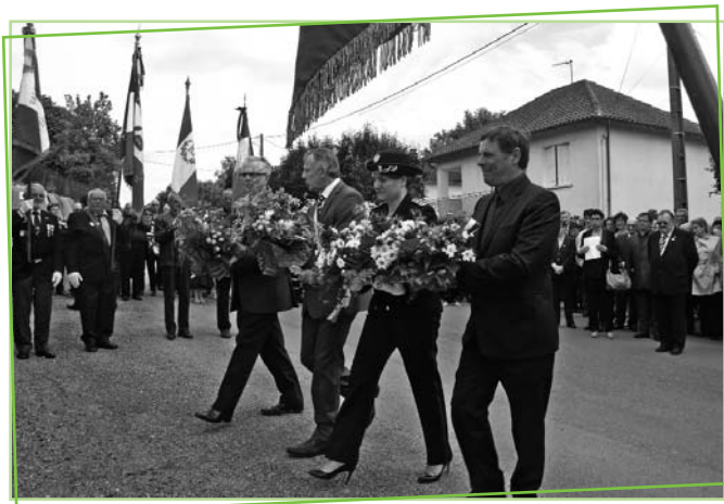
Dépôt de gerbe devant la plaque à la mémoire d'André Sainte-Marie, rue Figeagaise.