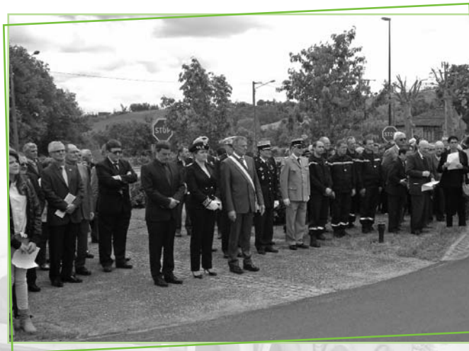
Recueillement devant le monument de la Déportation.

Le 12 mai 2014, la commune de MAURS a tenu à commémorer le soixante-dixième anniversaire de la rafle dont les maursois ont été victimes. Cette cérémonie a été organisée par la commune en collaboration avec l'Office National des Anciens Combattants et Victimes de Guerre (ONAC), l'Association des Amis de la Fondation pour la Mémoire de la Déportation (AFMD), les chefs d'établissements des collèges et lycée de Maurs ainsi que la chorale Arpège 122.