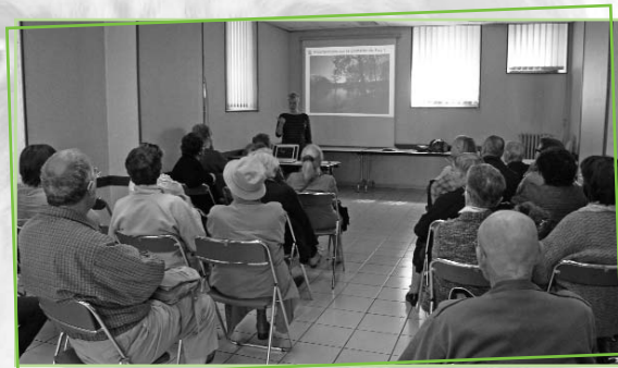
Assemblée Générale 2014