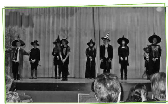
A cheval sur leur balai, les 9 jeunes sorciers et sorcières nous ont fait voyager jusqu'en Angleterre.

Implantée à Maurs depuis novembre 1965, date à laquelle la 1 ère Association locale s'est constituée sous la loi 1901, l'ADMR a connu bien des avancées tant sur le plan géographique que professionnel. L'arrêté du 24 février 1997 l'autorise à servir tout le canton de Maurs (à l'exception de Mourjou, Boisset, St-Antoine). Depuis 1998 l'Association bénéficie de l'agrément qualité, renouvelé notamment en 2012. Avec l'appui de la Fédération, l'Association est donc engagée dans une procédure de démarche Qualité. Connaissances, compétences, professionnalisme sont consolidés par la formation continue des 21 salariées intervenant auprès des familles aidées. (Thèmes proposés : adaptation à l'emploi, alimentation aux personnes fragilisées, relation d'aide lors d'une fin de vie, manutention et ergonomie, entretien du linge, petite enfance, gestion des comportements agressifs, maladies de Parkinson et Alzheimer, maladie physique et troubles du comportement...).