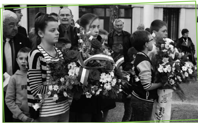
19 mars 2014

Les cérémonies se sont déroulées dans le recueillement