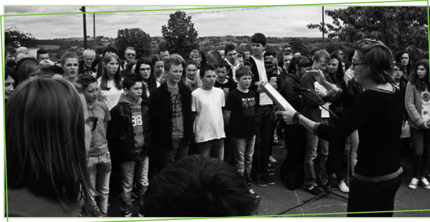
Les élèves du Collège Sainte-Flore accompagnés par Arpège 122.