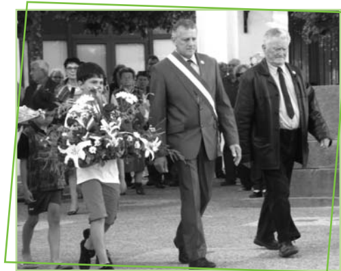
8 mai 2014