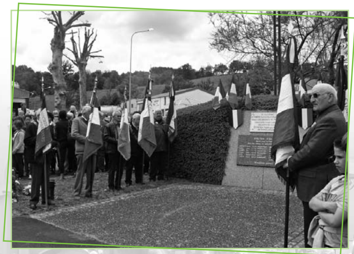
Les portes drapeaux devant le monument de la Déportation.