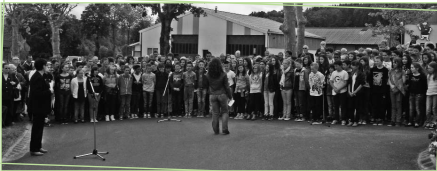
Les élèves du Collège des Portes du Midi accompagnés par leur professeur de musique.