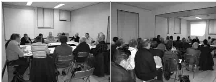
Réunion de travail des acteurs du projet

Un sens de circulation est pressenti : la montée rue de l'Oratoire et la descente route du Cimetière. Sur cette portion, la chaussée sera traitée en béton bitumineux. Au-delà de la rue du cimetière, elle sera traitée en revêtement tri couches. En amont du second accès au cimetière, des stationnements seront aménagés, coté droit sens montant. Le mur en pierre existant au droit du Château d'eau sera reconstruit. Du cimetière à Cibut la chaussée sera délimitée par un caniveau.