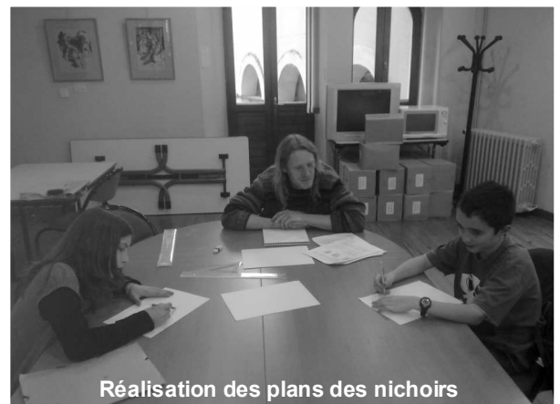
Réalisation des plans des nichoirs