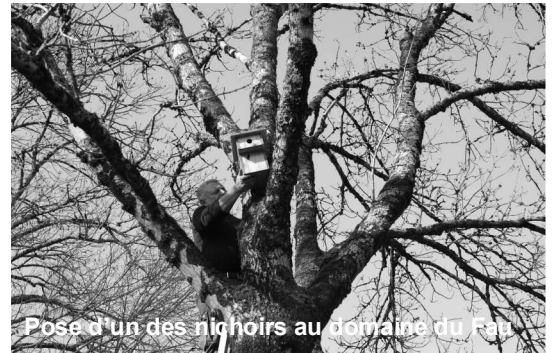
Pose d'un des nichoirs au domaine du Fau