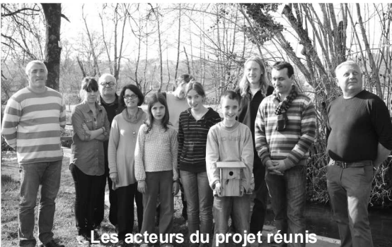
Les acteurs du projet réunis

Enfin, après une semaine d'attente nécessaire au séchage des réalisations, les efforts de chacun ont été récompensés. Les nichoirs ont été implantés avec l'aide des employés des services techniques municipaux, sur des lieux spécifiques, sélectionnés au préalable : face à l'école maternelle publique, au domaine du Fau et au jardin du Truel.