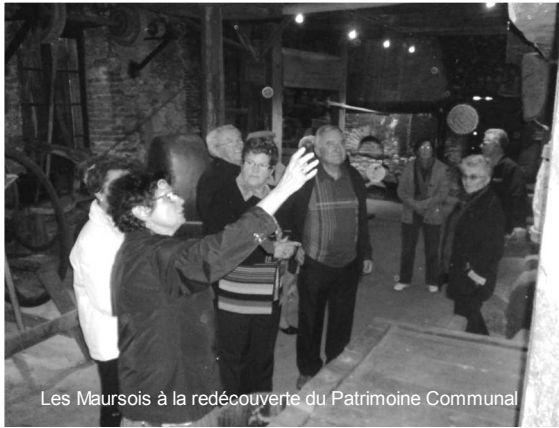
Les Maursois à la redécouverte du Patrimoine Communal

La Mairie (salle d'honneur et donation P.Miquel), l'Abbatiale, le Truel et le Moulin du Fau ont été ouverts au public lors des Journées du Patrimoine, les 14 et 15 septembre, pour une visite accompagnée libre et gratuite.