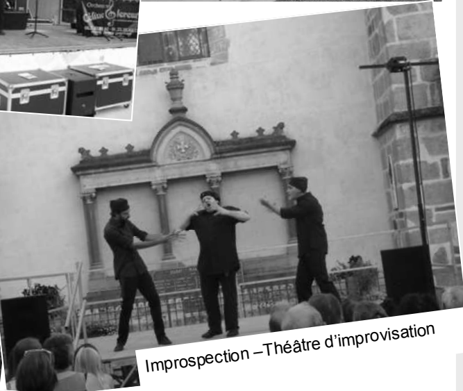
Improspection – Théâtre d'improvisation