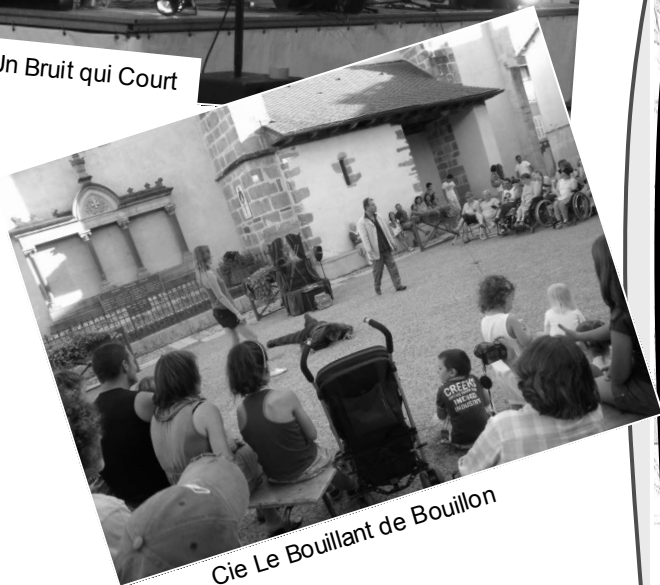
Cie Le Bouillant de Bouillon

C'est un encouragement pour faire encore mieux en 2014.