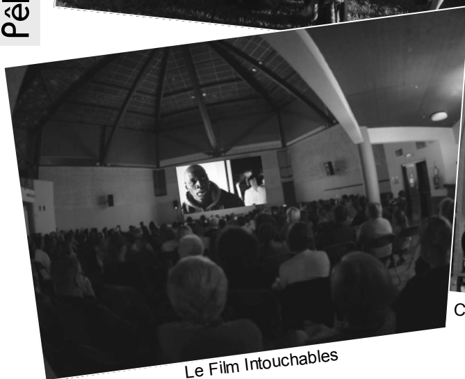
Le Film Intouchables