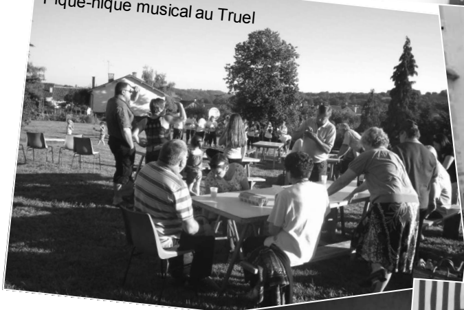
Pique-nique musical au Truel