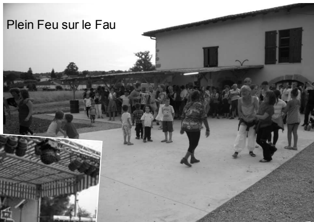
Plein Feu sur le Fau