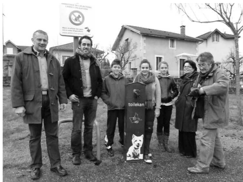
Installation de 5 « Toutounettes » ou distributeurs de sacs à déjections canines , en centre-ville.

Organisation du « Festijeunes », journée dédiée à la jeunesse sur Mours.