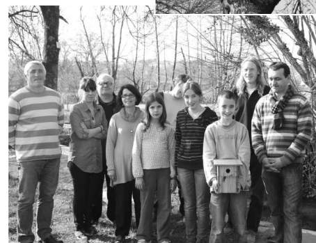
Réalisation et mise en place des mangeoires nichoirs à oiseaux.