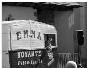
Les préalables Emma La Clown