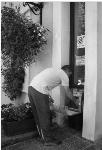
Pose du 2 ème Défibrillateur devant la mairie

Deux défibrillateurs à disposition du public