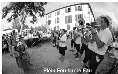
Plein Feu sur le Fau

Des animations gratuites pour être accessibles au plus grand nombre.