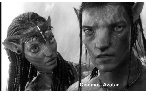
Cinéma - Avatar