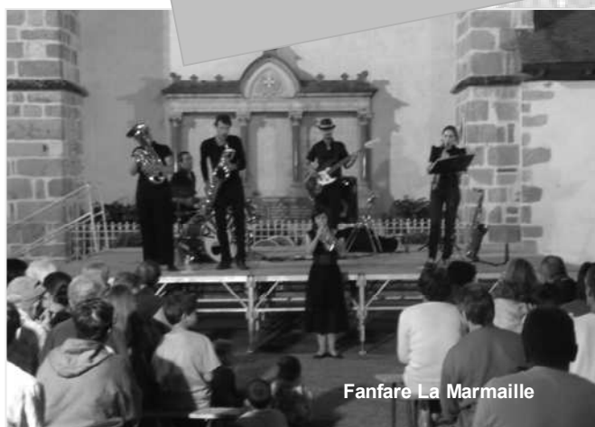
Fanfare La Marmaille