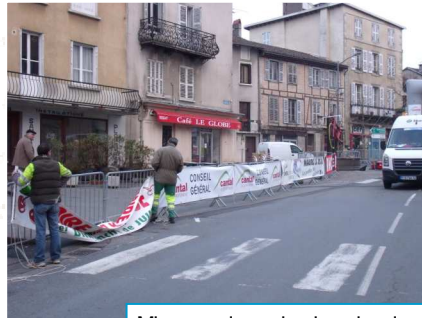
Mise en place des banderoles par les équipes municipales et les élus