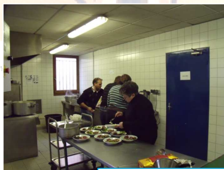
Les préparatifs du Casse-croûte, en cuisine et en salle