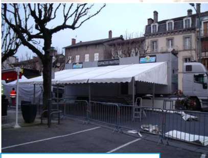
Montage de l'Espace invités