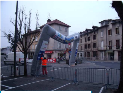
Gonflage de l'arche de Départ par les membres ASO