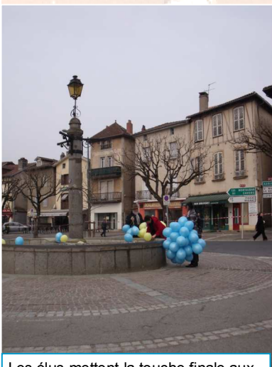
Les élus mettent la touche finale aux décorations