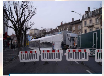
Montage de l'Espace invités achevé