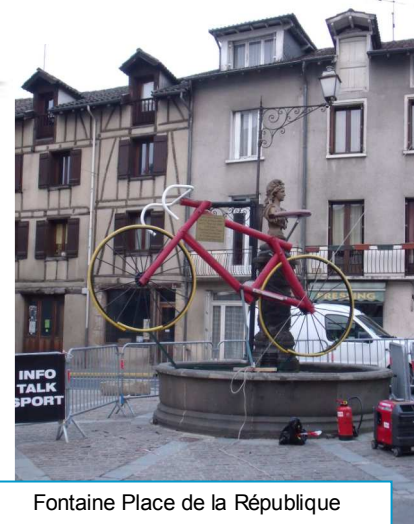
Fontaine Place de la République