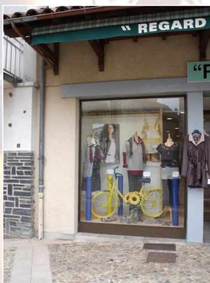
Commerces en centre-ville