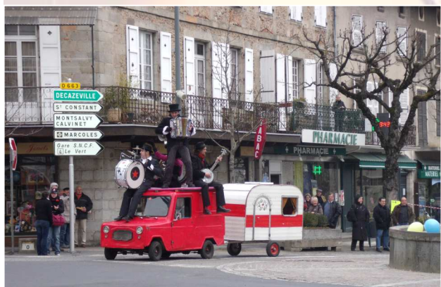
Une matinée animée agréablement par la compagnie du P'tit Vélo