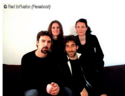
La Ganelette Mairsoise et Red InFusion participeront à cette soirée mémorable