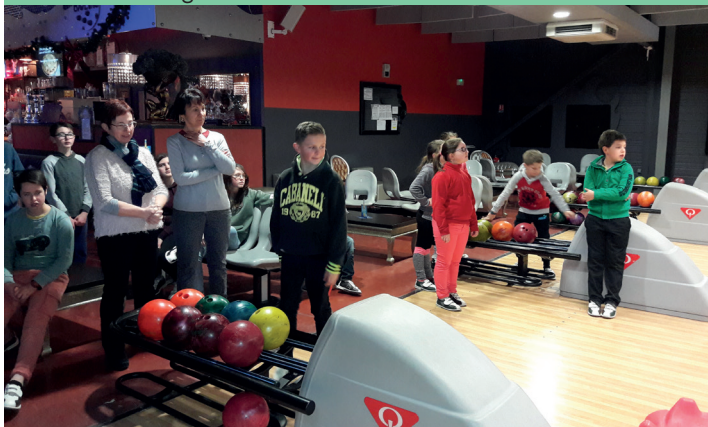
Sortie Bowling et Laser-Game à Aurillac, 28 Décembre 2018