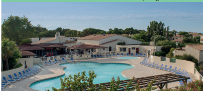
Club Belambra "Les Lauriers Roses", Cap d'Agde