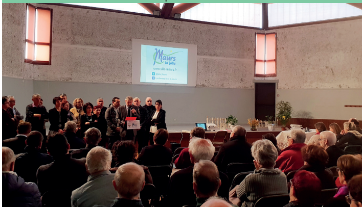
Vœux à la Population, 19 Janvier