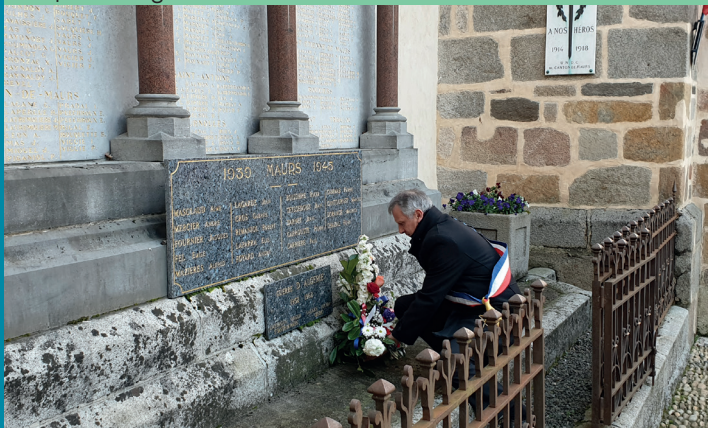
Dépôt de la gerbe devant le Monument aux Morts, 19 Mars 2019