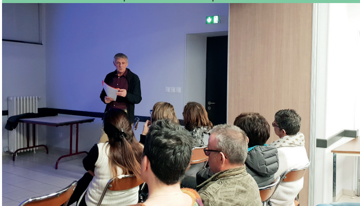
Vœux au personnel municipal, 16 Janvier