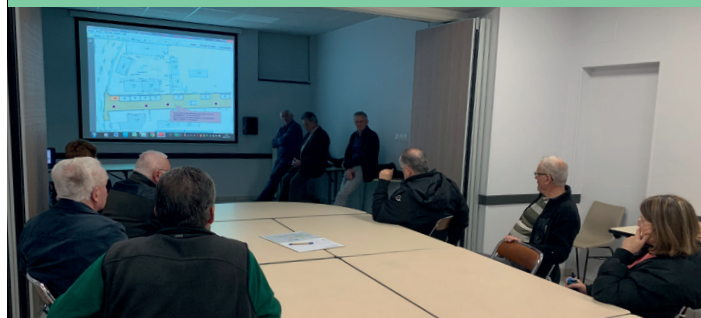
Réunion d'informations rue du 8 Mai, 6 Avril

Une réfection de voirie est en cours rue du 8 Mai. Elle va se poursuivre jusqu'au début de Mai 2019. Elle va permettre la réalisation d'une circulation piétonne et d'espace de stationnement. Les riverains ont été informés du déroulement des travaux.