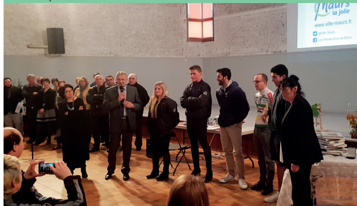
Sportifs de haut-niveau maursois honorés, 19 Janvier