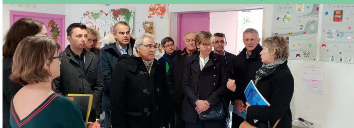
Visite du Multi-Accueil "Les P'tites Canailles", 8 Mars

À l'occasion de la Journée Internationale des Droits des Femmes , M me le Préfet s'est déplacée à Maurs afin de participer à une présentation de femmes actrices de leur insertion sociale et professionnelle à la Maison des Services. Elle a ensuite visité la crèche multi-accueil et l'atelier d'insertion Mosaïque .