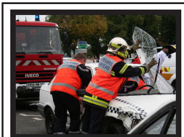
Sapeurs-Pompiers Professionnels et volontaires