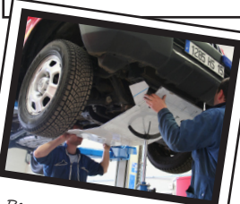
Personnels administratifs et techniques spécialisés

832 Sapeurs-Pompiers Volontaires dont 56 membres du Service de Santé et de Secours Médical. Hommes et femmes, citoyens ordinaires, ils ont choisi de consacrer une partie de leur temps libre à l'ensemble des missions des services d'incendie et de secours.